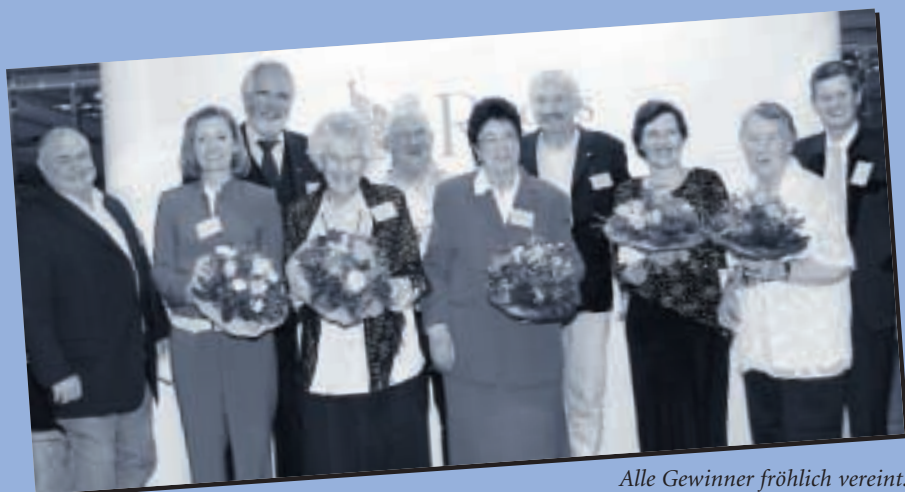
Alle Gewinner fröhlich vereint.

Für die Auszahlung der Preise gelten die Preislisten mit den jeweiligen Landeswährungen.